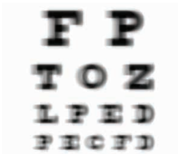
Visión con astigmatismo