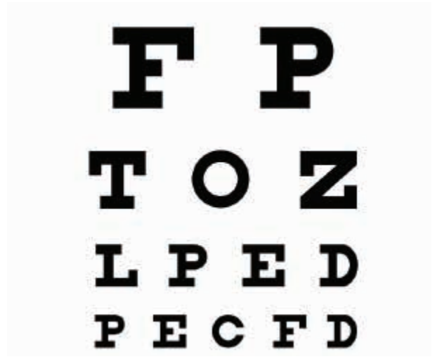
Visión después de corregir el astigmatismo

El implante Toric se puede considerar como un implante personalizado que contiene su medida individual, la cual corrige la miopía, hyperopía, y astigmatismo.